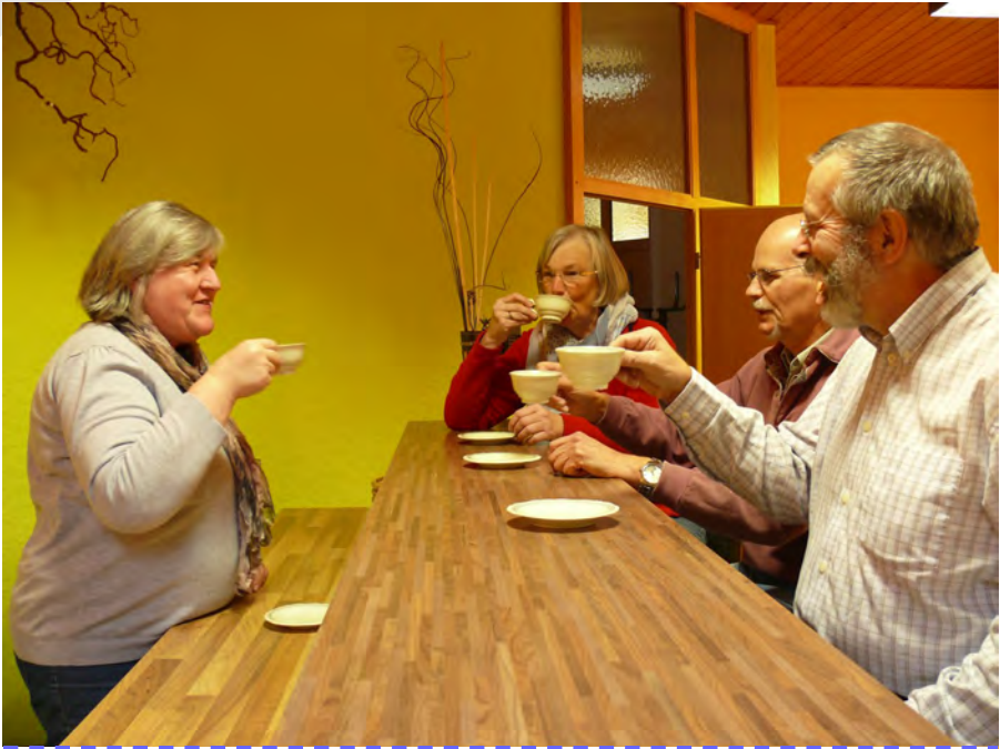
Die „probierBar“ wird eingeweiht

Interessierte können sich von der Qualität der Produktpalette in der angeschlossenen „probierBar“ überzeugen. In gemütlicher Atmosphäre werden Kaffee, Tee und Gebäck serviert.